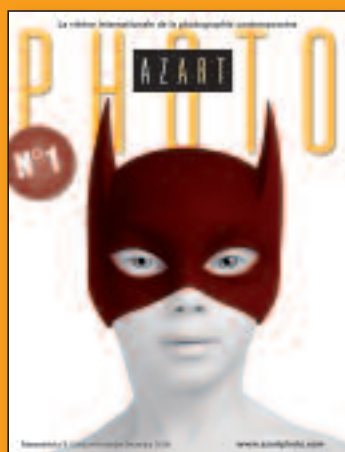
N°1 Octobre-Novembre-Décembre 2008