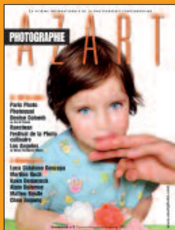
N°5 Octobre-Novembre-Décembre 2009