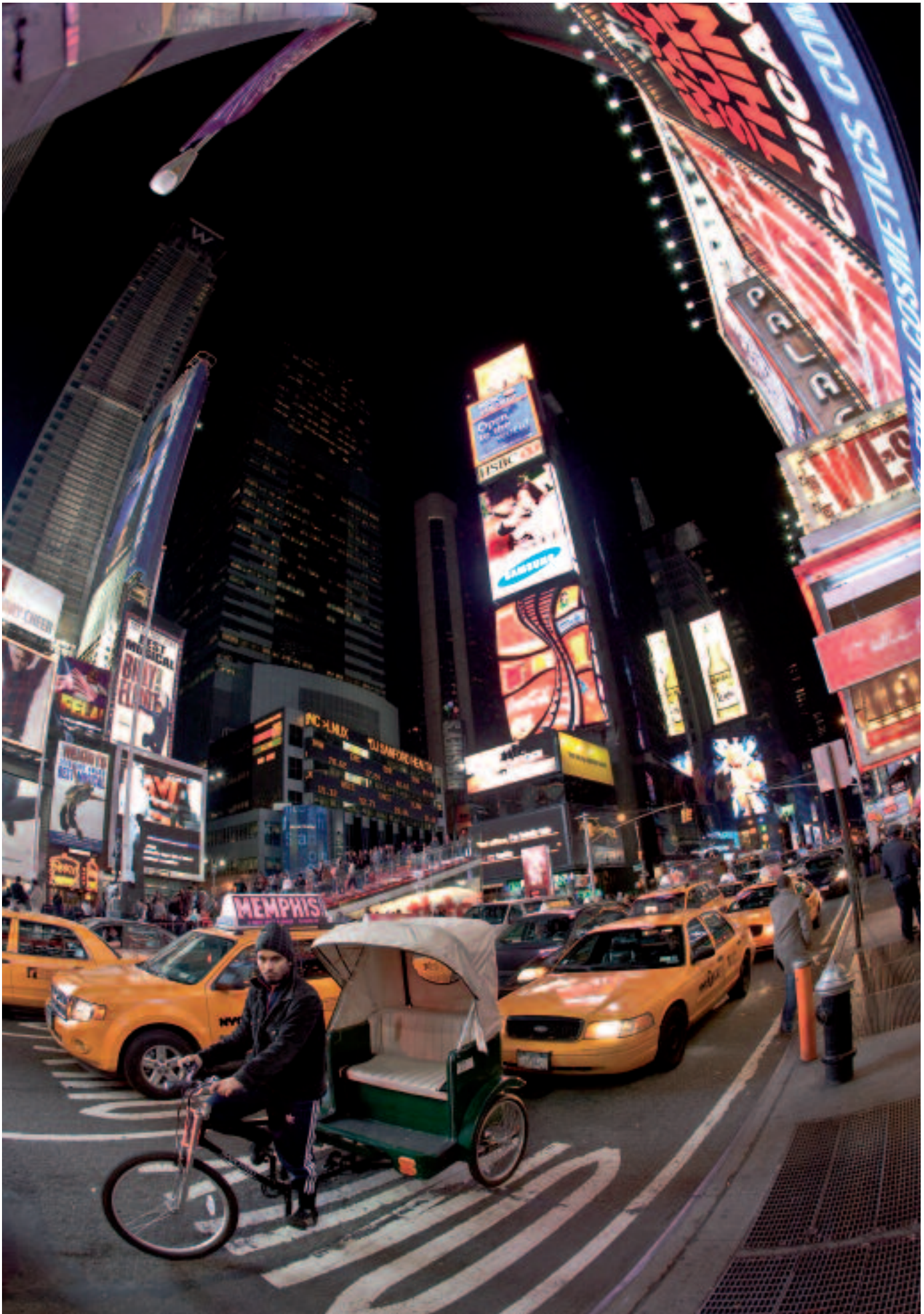
Rue nuit, première partie du diptyque