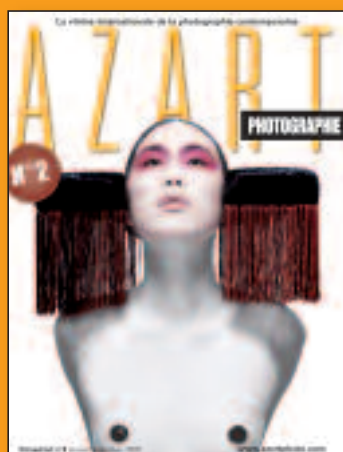
N°2 Janvier-Février-Mars 2009