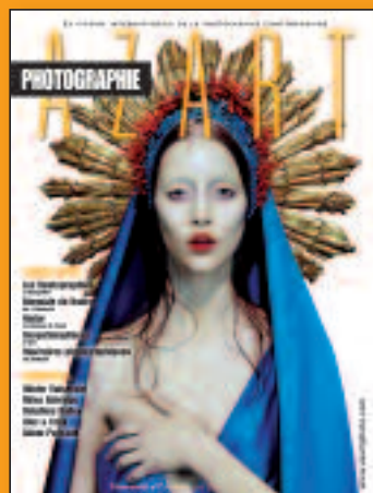
N°7 Avril-Mai-Juin 2010