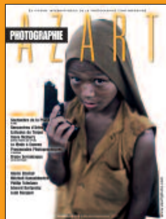
N°8 Juillet-Août-Septembre 2010

10€ L'EXEMPLAIRE* (Frais d'expédition inclus)