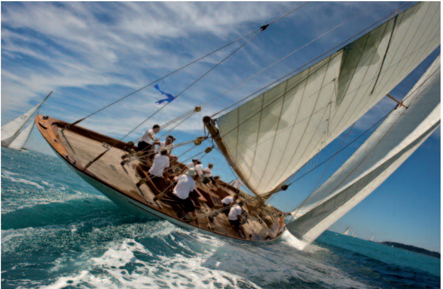
Voiles Antibes 2010

annoncés le samedi 20 et le dimanche 28 pour le Prix du Public), une brocante de vieux matériels photographiques et, originalité du festival, un Marathon photo. Le dimanche 21 novembre, trois thèmes seront ainsi révélés à deux heures d'intervalle, à charge pour les participants d'illustrer chacun de la manière qu'il souhaite. Une sélection de photographies réalisées lors du Marathon fera l'objet d'une exposition les 27 et 28 novembre dans le cadre du Festival. L'exposition permanente, visible tout au long de la manifestation au Palais de l'Europe, offre une grande variété de styles et de parcours. Patrick Hanez par exemple s'intéresse particulièrement au monde de la Mer : « La Côte d'Azur est une très belle région qui se prête à ce genre de clichés. En mer, le visage fouetté par les embruns, vous avez une sensation de bien être et de