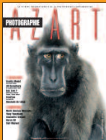
N°6 Janvier-Février-Mars 2010