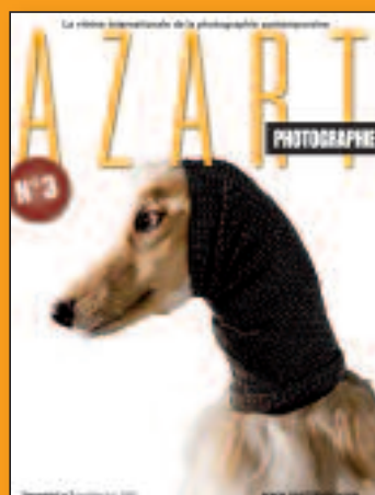
N°3 Avril-Mai-Juin 2009